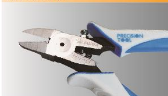
KÌM CẮT NHỰA