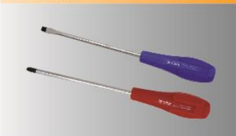
TƯỚC NƠ VÍT